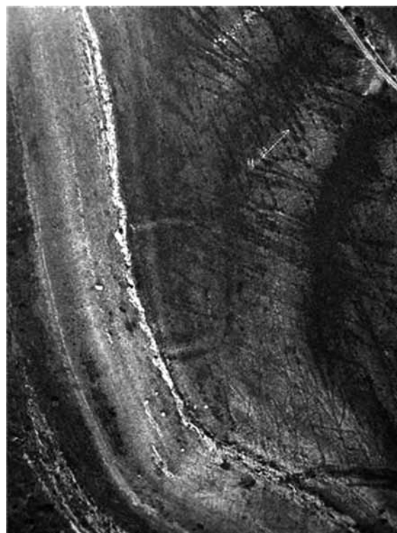
Fig. 2. Campamento de Castrillo.

La estructura se adosa al cortado para aprovechar la defensa natural. La orientación del mismo, por lo tanto, toma como el eje NO-SE como el principal, lo que altera la orientación ideal de un campamento pero que se justifica como indispensable para aprovechar las ventajas del terreno (Fig. 2). El diseño en