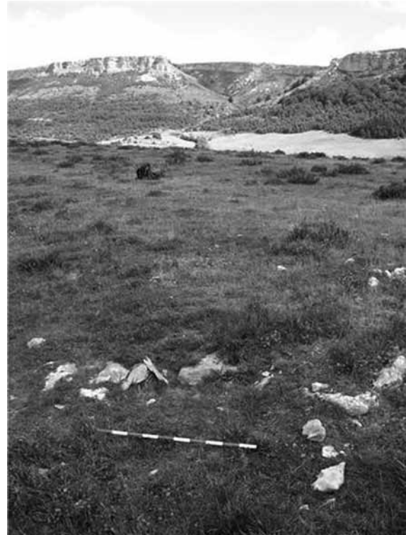
Fig. 3. Puerta en clavícula.

en torno a los 370 legionarios, menos de una cohorte. Pero debemos tener en cuenta que no es probable que toda la zona de acampada estuviese ocupada, dejando libre, como mínimo, el perímetro interno de la defensa ( intervallum ) para facilitar su acceso y tránsito y algunos espacios para el tránsito, por lo que los efectivos serían menores. Si a ello le unimos el hecho, como se ha mencionado, de que se acampa por unidades, la cifra aproximada, podría rondar en torno a las 2-3 centurias, 160-240 hombres (Le Bohec: 2004: 33-39; Goldsworthy, 2005: 46-48).