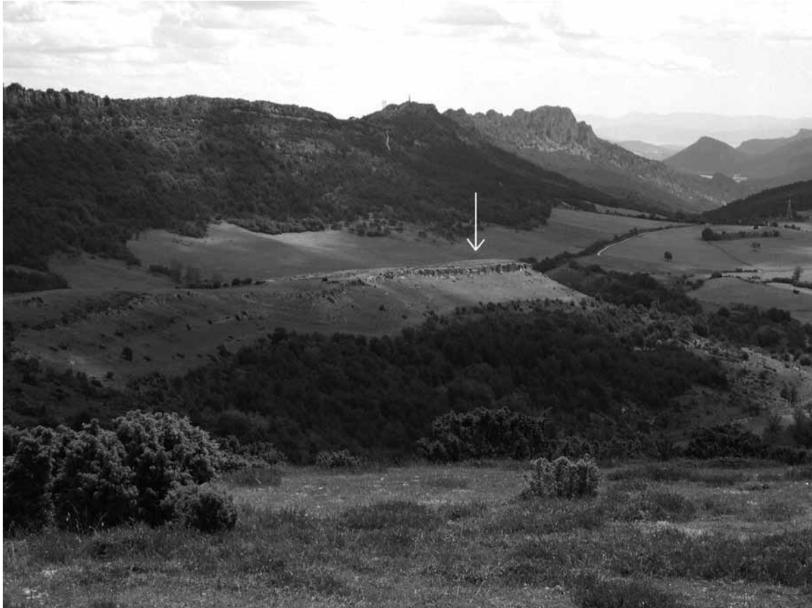
Fig. 1. Situación del campamento de Castrillo.

A la par que se hizo la prospección arqueológica se hizo una pequeña recogida de datos etnográficos. La etnografía de la zona bajo estudio, frecuentemente, ayuda a comprender los yacimientos arqueológicos.