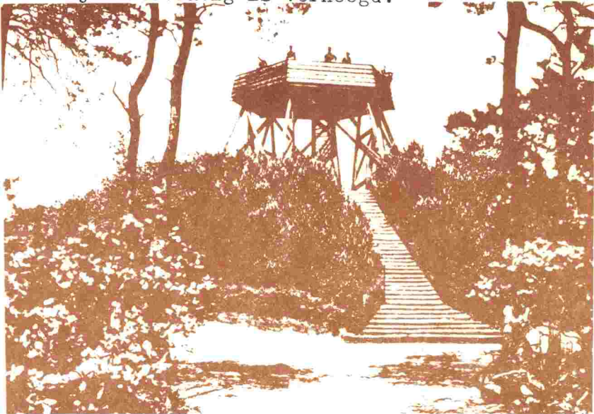
Gezicht op de uitkijktoren.

Men noemde de Tafelberg vroeger ook wel Kooltjesberg. Deze naam duidt wellicht op de aanwezigheid van vele koolmezen. Dat de Huizer vissers hier houtskoolvuren ontstoken zouden hebben als een bakken voor hun schepen op zee lijkt onwaarschijnlijk. Immers, indien ze dit deden zouden ze zeker een van uit de zee meer zichtbare plaats hebben genomen, dichterbij huis b.v. de Aalberg of de Kerkenberg. Deze "berg" is een overblijfsel uit de ijstijd, die in later tijd kunstmatig is verhoogd.