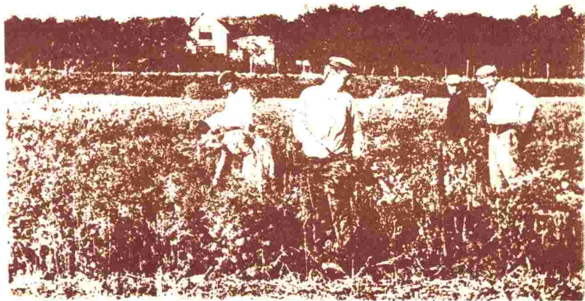
Kolonisten in het lupineveld.