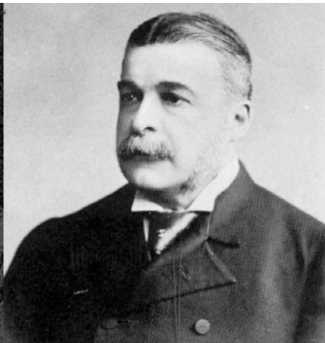
SIR ARTHUR SULLIVAN