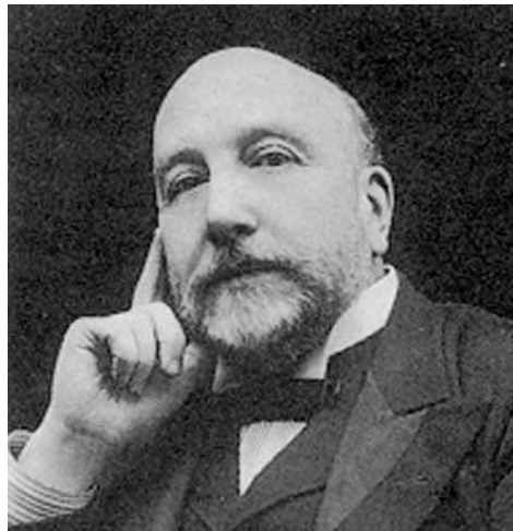
SIR ALEXANDER MACKENZIE

Yet it was probably the two most significant events of the previous year that prompted the 32-year-old composer to undertake this idealised portrait of knightly valour and fidelity to a lady-love: his marriage, and the overwhelming impression created by performances at Covent Garden of Die Meistersinger . The arresting opening of Froissart has the unmistakable imprint of Elgar, but the jaunty, dotted 'knightly' figure that pervades much of the overture's thematic material can be traced back directly to the music with which Walther