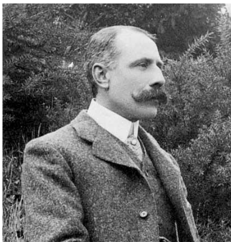
SIR EDWARD ELGAR

L'ouverture Chevy Chase date de 1836, composée à l'origine pour le théâtre, elle fut très vite acceptée comme