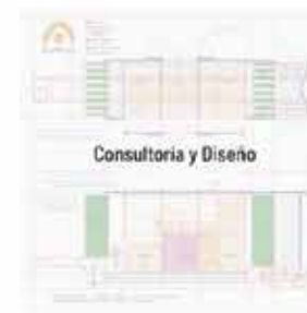
Consultoría y Diseño