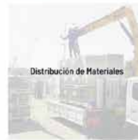
Distribución de Materiales