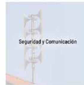
Seguridad y Comunicación