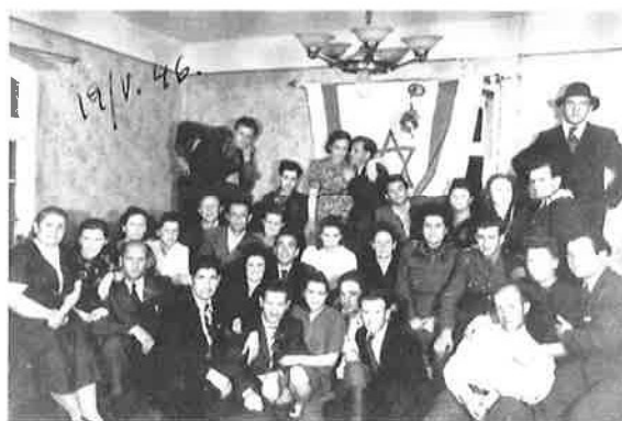
Am 19. Mai 1946 feierte eine Gruppe von Frauen und Männern des „Camp Kaunitz“ in der Gastwirtschaft Brockbals am heutigen Fürst-Wenzel-Platz. (Entnommen aus: Was uns bleibt. Eine Arbeit eingereicht von Schülerinnen und Schülern der Anne-Frank-Schule Gütersloh, Gütersloh 1993, S. 180)

wie ihr Eigentum zerstört wurde oder in den Schwarzhandel einging. Sie beschrieben auch, dass viele ihrer von der Einquartierung nicht betroffenen Nachbarn sich nicht solidarisch zeigten: Die „Bewohner der Umgegend“ wollten „zwar keineswegs die Ausländer bei sich aufnehmen, wohl aber Geschäfte mit ihnen machen“, indem sie ihnen Geflügel, Eier, Butter und Fleisch verkauften. Es folgten Klagen über das sittliche Verhalten der DPs – „gebrauchte und dann weggeworfene Gummartikel“ wurden gefunden – und über katastrophale hygienische Verhältnisse – „in Unordnung gebrachte“ Pumpen, Hauswasserversorgungen, Toiletten und Badeeinrichtungen – auch in der durch DPs belegten Schule. Beides beeinträchtigte die Schul-