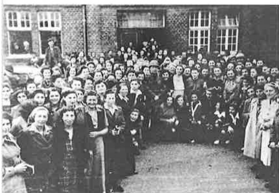
Die Aufnahme zeigt eine Gruppe ehemaliger Zwangsarbeiterinnen im Mai 1945 gemeinsam mit amerikanischen Soldaten vor dem Haupteingang der Gastwirtschaft Liemke in Kaunitz. Einen Monat nach ihrer Befreiung wirken die Frauen äußerlich bereits ein wenig erholt.

kinder, denen unter den gegebenen Umständen überdies kein geregelter Unterricht erteilt werden konnte. Denn es stand zwar seit dem Januar wieder ein Klassenzimmer zur Verfügung 37) , da die Schule jedoch weiterhin als Unterkunft und Lebensmittelausgabestelle für die DPs diente, waren Störungen unvermeidlich. 38) Abends fanden in den Schulräumen Filmvorführungen oder Konzerte statt, so dass am folgenden Morgen die Sauberkeit „sehr zu wünschen übrig“ ließ. 39) Klage über „die beispiellosen sittlichen Mißstände in Kaunitz“ hatte Bürgermeister Maasjost bereits im Juli 1945 in einem Bericht an den Landrat geführt. 40) Er umschrieb damit die Promiskuität einzelner DPs, die auch in der oben genannten Eingabe angedeutet wird. 41)