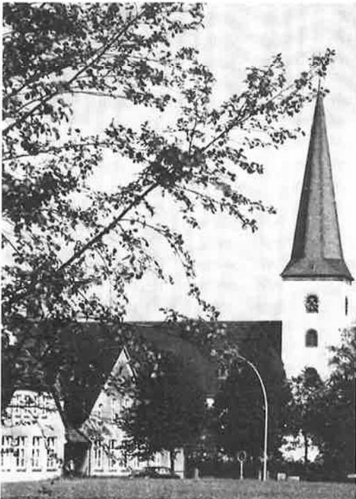
↑ Die bei der St.-Maria-Immaculata Kirche gelegene Dorfschule Kaunitz diente nicht nur einer größeren Zahl der befreiten Frauen als Unterkunft, sondern war auch Verpflegungsstelle und Veranstaltungsort.

vor diese Situation gestellt sahen, die Frauen bei der Belegung der Häuser und Wohnungen des Dorfes. Denn nur indem sie sie an den Ort banden, konnte verhindert werden, dass sich die Gruppe zerstreute und damit ihre geplante Repatriierung erschwert würde. So entstand das DP-Lager „Camp Kaunitz“ 8) – als eines von über 300 9) in Westfalen.