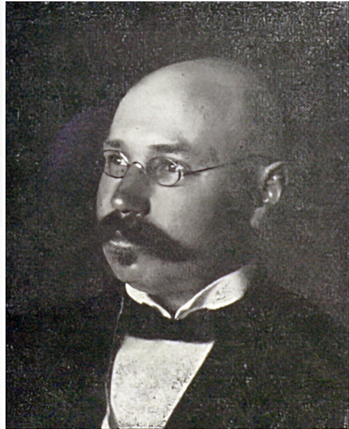
Abbildung 3. Gustav Beckmann (undatiert). Abgebildet in Deutsche Tonkünstler und Musiker in Wort und Bild , hrsg. von Friedrich Jansa, 2. Aufl. Leipzig 1911, S. 29.

Zwischen zwei großen Besprechungen zu der Orchester-Uraufführung 103 meldete das gleiche Blatt: