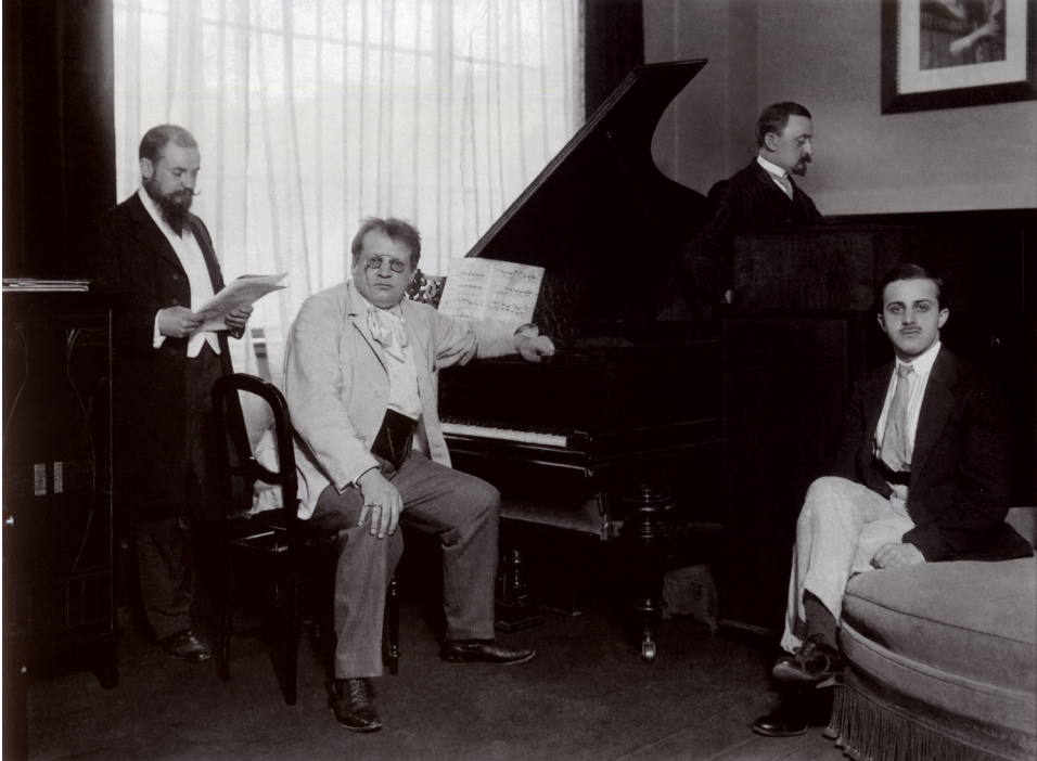
Abbildung 5. Max Reger bei Aufnahmen für die Firma Ludwig Hupfeld, Leipzig 1. Juni 1908.

einer Metronomangabe versehene Stück; langsamer als gefordert (90 statt 120 bis 150), aber ebenfalls nicht im mathematisch halben Tempo.