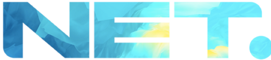
Gambar 2.1. Logo NET. (dokumen perusahaan, 2019)