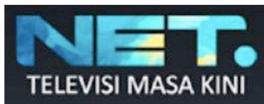
Gambar 2.2. Logo NET. dengan slogan (dokumen perusahaan, 2019)

Slogan NET TV yaitu “Televisi Masa Kini” yang diartikan bahwa NET ingin menjadi televisi yang mementingkan kualitas dan teknologi dalam penayangannya.