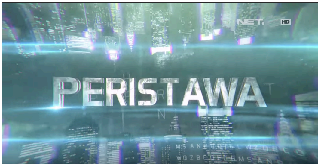
Gambar 2.4. Logo Peristawa