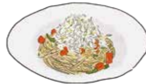
Peperoncino Spaghetti with Whitebait & Perilla しらすと大葉のペペロンチーノ スパゲッティ R ¥1680 / L ¥2480